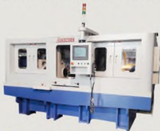
CNC數控換刀 ATC雙端搪孔機 FBHDS42A CNC ATC FINE BORING MACHINE