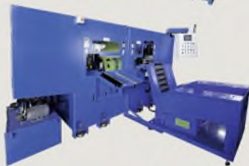
自動伺服雙端車斷倒角機 DOUBLE CUT AND CHAMFER MACHINE