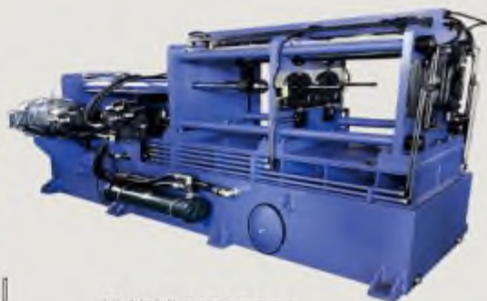
抽管機 HC6803A BUTTING MACHINE